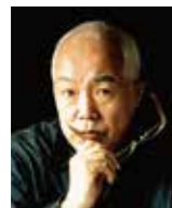
全日本書道芸術院 理事長