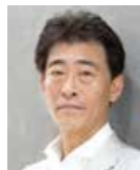
デザイン書道家 一般社団法人 日本デザイン書道作家協会 理事長

書家 1949年岡山県生まれ。公益社団法人日展理事 読売書法会 最高顧問 謙慎書道会 理事長 公益財団法人全国書美術振興会理事長 公益社団法人全日本書道連盟副理事長 大東文化大学名誉教授 寄鶴文社理事長